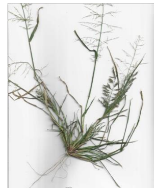
Eragrostis albensis , Elbeliefdegras