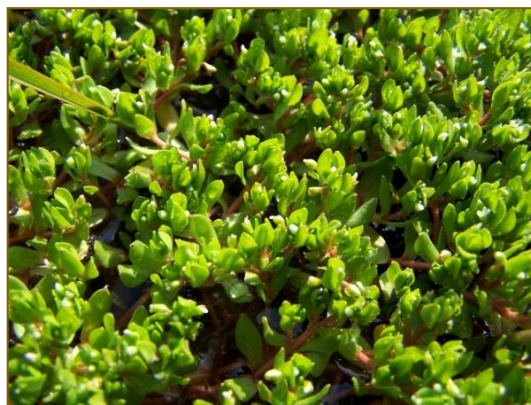
Afb. 25 Montia minor

Kilometerhok 263-484, west van de Hakenberg bij Oldenzaal, was al meer dan tien jaar gelden voor het laatst onderzocht. We vonden tijdens de excursie veel van de bijzondere bossoorten terug: langs de Hakenbergweg noteerden we naast Viola riviniana en V. reichenbachiana (Donkersporig en Bleeksporig bosviooltje) en Lamium galeobdolon subsp. galeobdolon (Gele dovenetel) ruim 25 pollen Carex sylvatica (Boszegge) en enkele tientallen exemplaren Neottia ovata (Grote keverorchis). Aan een natte slenk nabij de Populierendijk was een dertigtal planten Valeriana dioica (Kleine valeriaan) een verrassing; ze werd hier