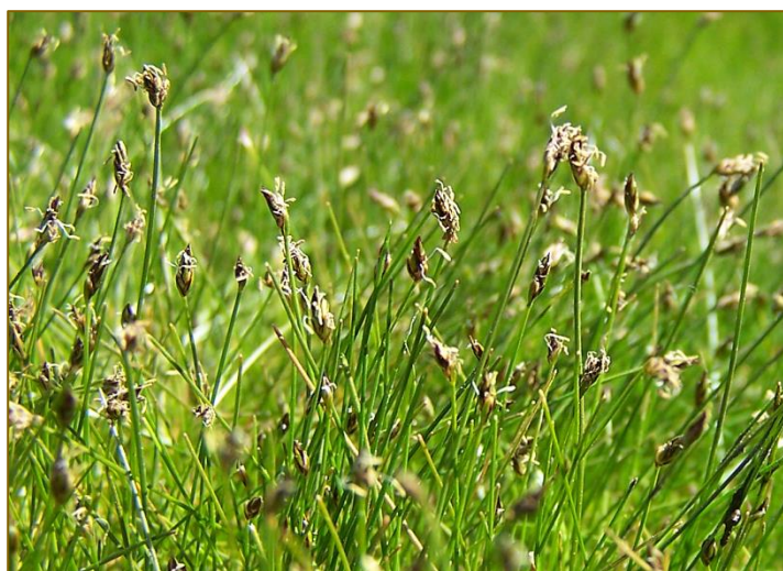
Afb. 26 Eleocharis acicularis

begeleid door honderden planten Lysimachia nemorum (Boswederik), Adoxa moschatellina (Muskuskruid), Caltha palustris subsp. palustris (Gewone dotterbloem) en beschaduwed door Crataegus laevigata (Tweestijlige meidoorn) en een Mespilus germanica (Mispel). In het uiterste oosten van het hok tenslotte troffen we in en langs een poeltje Montia minor (Klein bronkruid), Lythrum portula (Waterpostelein) en Carex oederi subsp. oedocarpa [syn. Carex demissa ] (Geelgroene zegge) aan. In totaal 202 taxa.