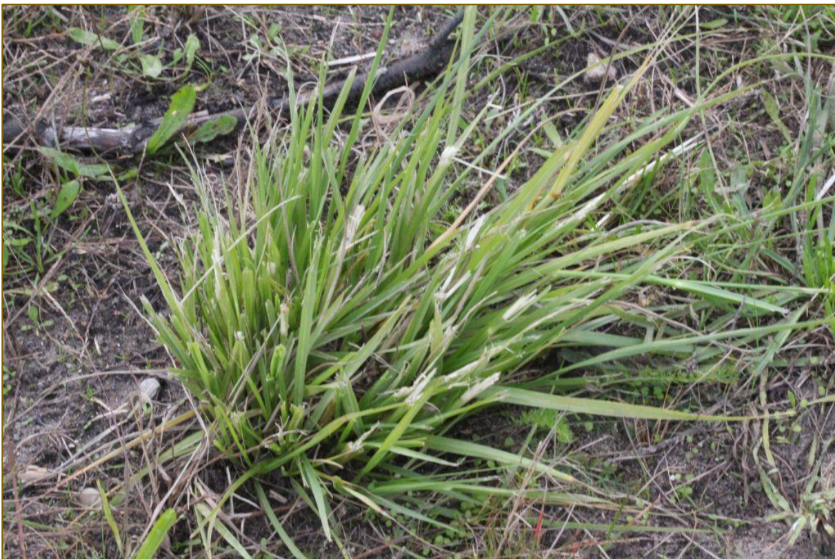
Afb.29 De Sporobolus indicus zag er na een maaibeurt zo uit, maar zou de winter goed kunnen overleven.