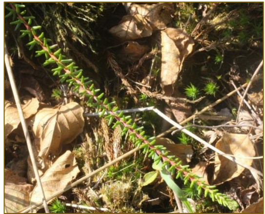
Afb. 28 Empetrum nigrum

Overige vermeldenswaardige soorten: Osmunda regalis (Koningsvaren), Oenothera deflexa (Zandteunisbloem) en Oenothera x fallax (Bastaardteunisbloem). Ook zagen we nog een aantal Bandheidelibellen ( Sympetrum pedemontanum ).