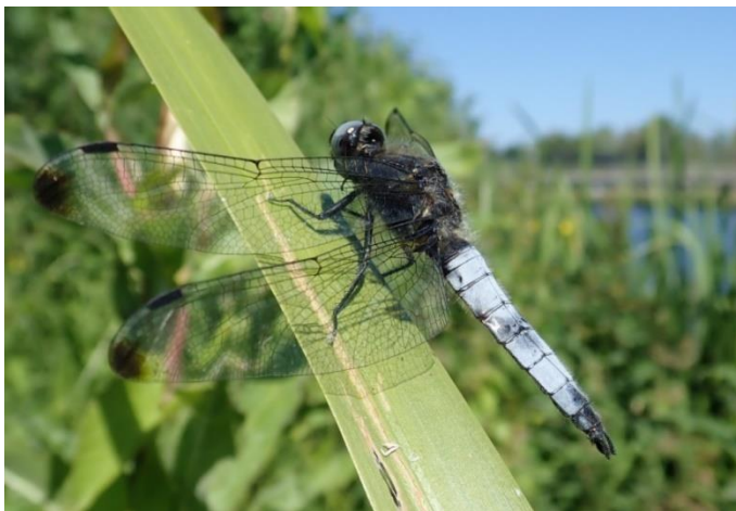
Foto 1: Op een blad Kalmoes rust een Bruine korenbout ( Libellula fulva ) aan de oever van de Vecht.

met de berm met een paar soorten Libellen ( Odonata ) (foto 1). Terug bij de parkeerplek staken we nu het kanaal over waar in de zandige bermen Gewone rolklaver ( Lotus corniculatus var. corniculatus ) werd gevonden